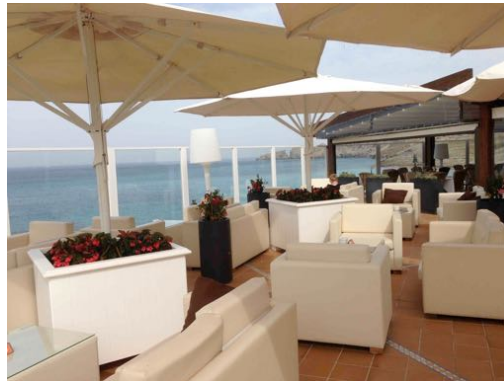
Der Selection- Frühstücksbereich, über dem Meer

Seminarzeiten können in Absprache mit den Teilnehmern wetterbedingt geändert werden.